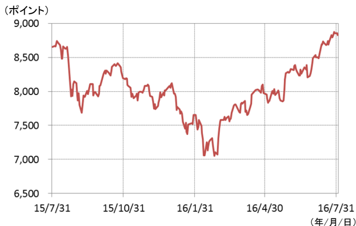
S&P BSE100種指数(ムンバイ100種指数)の推移 (期間：2015年7月31日～2016年8月2日、日次)