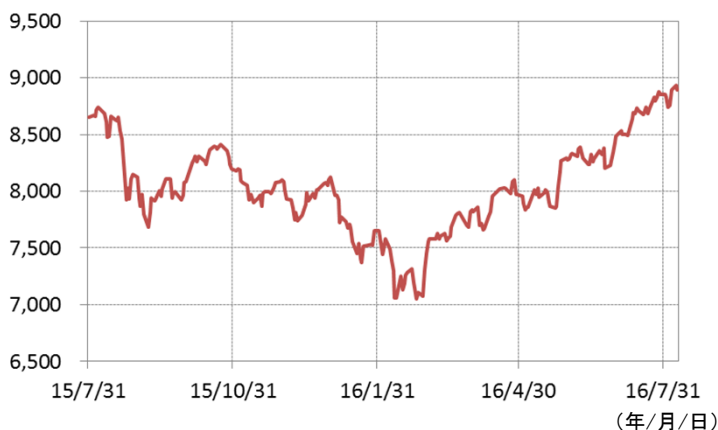
S&P BSE100種指数(ムンバイ100種指数)の推移 (期間：2015年7月31日～2016年8月9日、日次)