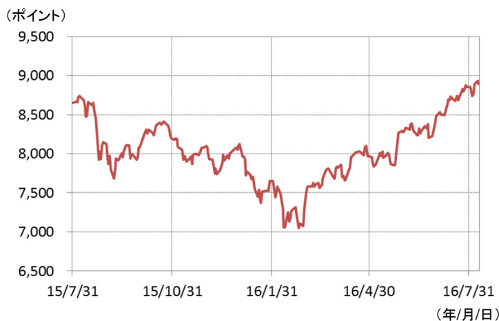
S&P BSE100種指数(ムンバイ100種指数)の推移 (期間：2015年7月31日～2016年8月9日、日次)