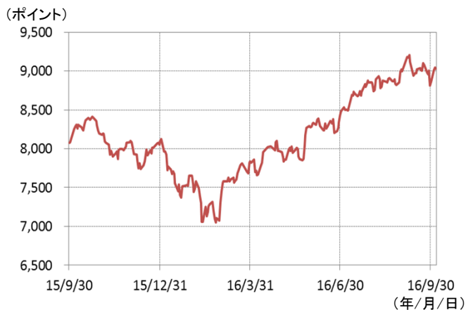
S&P BSE100種指数(ムンバイ100種指数)の推移 (期間：2015年9月30日～2016年10月5日、日次)