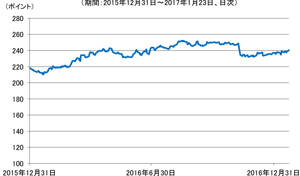
現地通貨建てエマージング債券の推移 (期間: 2015年12月31日~2017年1月23日、日次)

※現地通貨建て債券: JPモルガン・ガバメント・ボンド・インデックス・エマージング・マーケット・ブロード・ダイバーシファイド(米ドル建て、為替ヘッジなし)