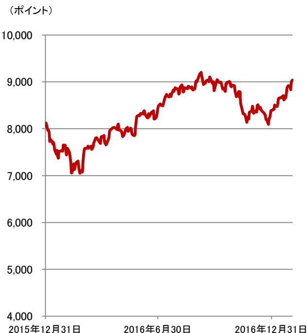
S&P BSE100種指数(ムンバイ100種指数)*の推移 (期間:2015年12月31日～2017年2月3日、日次)