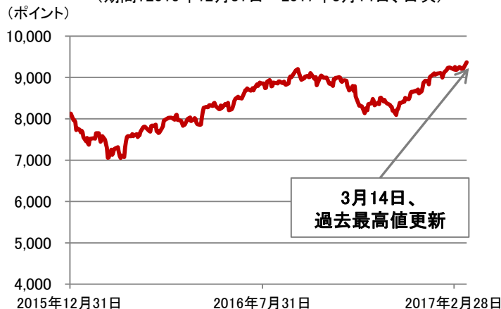
【S&P BSE100種指数(ムンバイ100種指数)*の推移】 (期間: 2015年12月31日~2017年3月14日、日次)

* S&P BSE100種指数(ムンバイ100種指数)とは、ボンベイ証券取引所の上場100銘柄により構成された指数です。