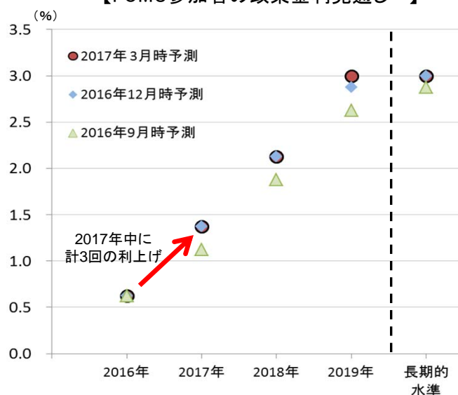
【FOMC参加者の政策金利見通し*1】

エマージング市場の債券にとって大きなマイナス要因となるのは、FRBが早いスピードで予想以上の大幅な利上げを行うことであると考えていますが、その可能性は薄まってきていると思われ、米ドル高も抑制されていることから、 この良好な需給環境は今後も続く可能性が高い と考えています。