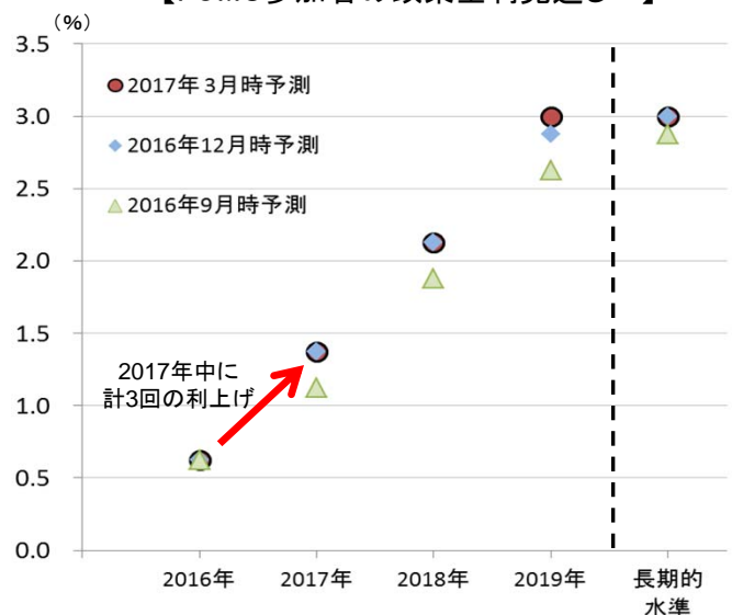
【FOMC参加者の政策金利見通し*1】

このコメントを受けて、2017年に3回の利上げ(今回分含む)という市場コンセンサスは維持されていますが、 利上げ期待はわずかに低下し、金利見通しは歴史的な低水準に留まっています。