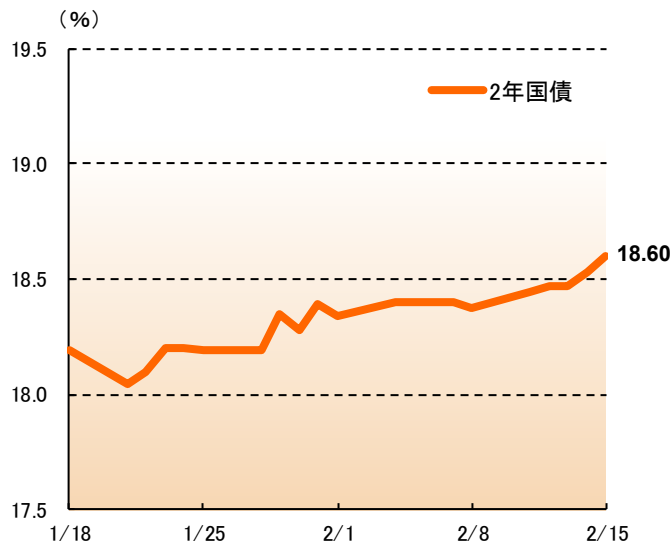
【トルコ 金利推移】 (2019年1月18日～2019年2月15日)

シリア情勢を巡っては、対米関係も含め引き続き留意する必要があると考えていますが、米中貿易協議に関するヘッドラインが増えており、足元で欧州の景気減速が懸念されていることから、目先は市場のリスクセンチメントが材料になりそうです。