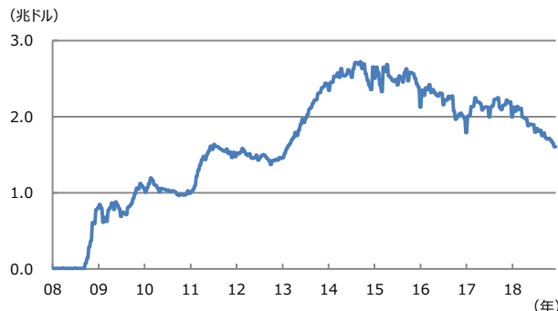
【図表2：米民間金融機関の超過準備預金残高】