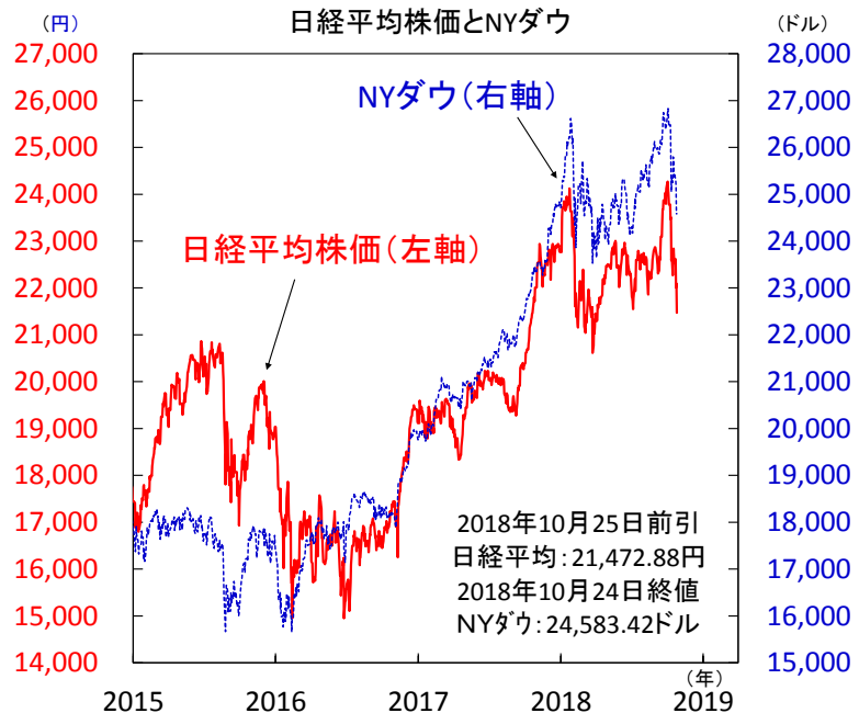
【図1】24日の米国株大幅下落を受けて、日経平均株価は21,000円前半に下落

注) 直近値は日経平均株価が2018年10月25日前場引値、NYダウが同年10月24日終値。