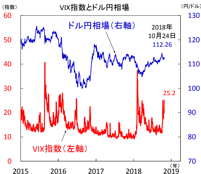
【図2】VIX指数が上昇、リスク回避の動き強まる

注) 直近値は2018年10月24日。VIX指数（ボラティリティ・インデックス）はS&P500対象のオプション取引を元に算出され、投資家心理を示す数値として利用、先行き不安が生じれば上昇する傾向。